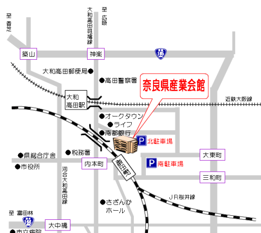
奈良県産業会館への交通略図